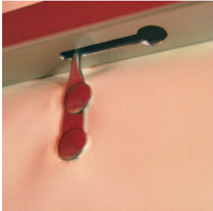
Mit Stahlhaken werden die Seitenplanen in den Ausfräsungen am Gerüst befestigt