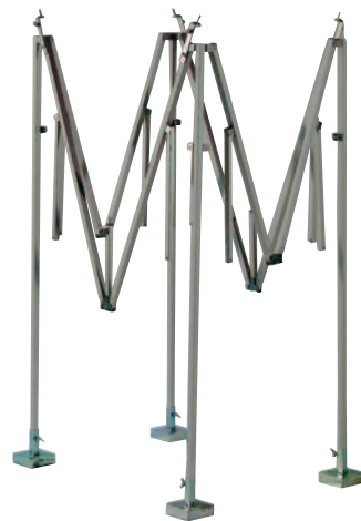
Gestell auseinanderziehen, das Klappgelenk rastet automatisch ein