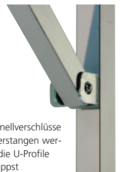
Die Schnellverschlüsse der Querstangen werden in die U-Profile eingeklippt