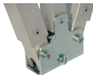
Die Technik liegt im Detail – Klappgelenk mit Einfingerbedienung