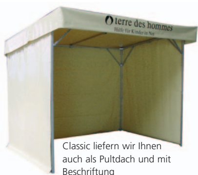
Classic liefern wir Ihnen auch als Pultdach und mit Beschriftung