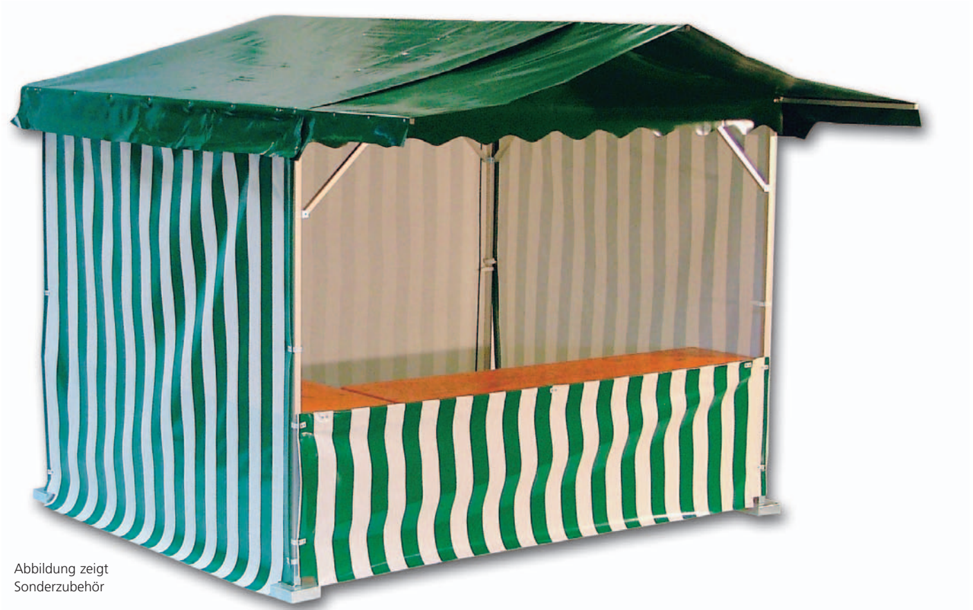
Abbildung zeigt Sonderzubehör