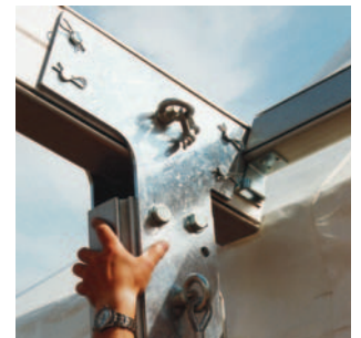
Massive, leicht zu handhabende Systembausteine für einfachste Montage