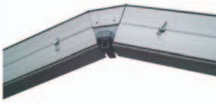
Der Firstkopf mit Übergangsbereich für einen schonenden Planeneinzug