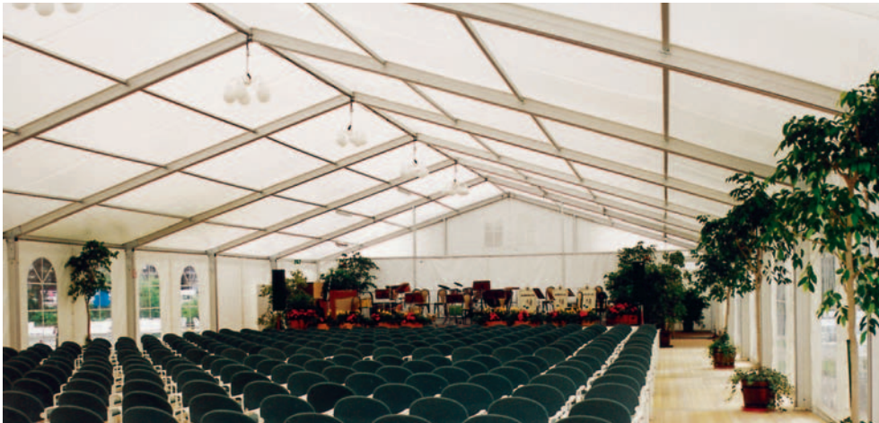
Ob Konzert- oder Festzelt, Sie sind immer durchdacht überdacht