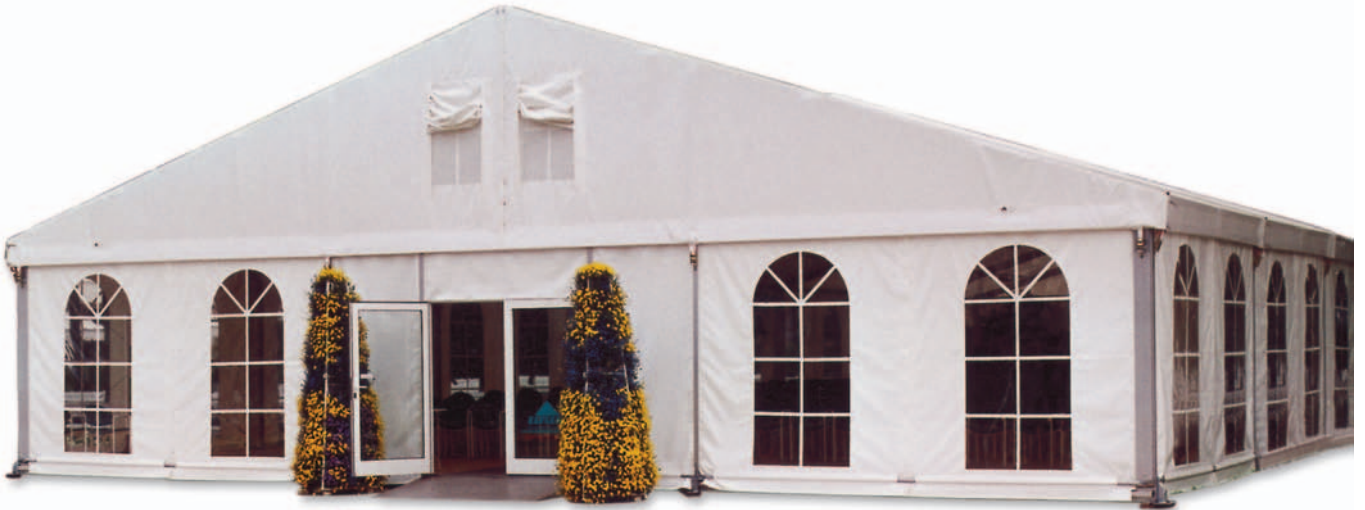
Abbildung zeigt Sonderzubehör