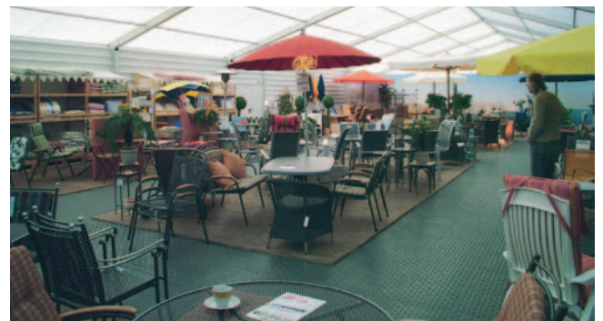
Favorit mit Trapezblechverkleidung als Ausstellungszelt z.B. für Gartenmöbel