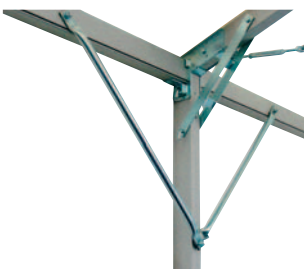
Eckstreben für hohe Stabilität in jedem Feld. Störende Seile und Querstangen entfallen