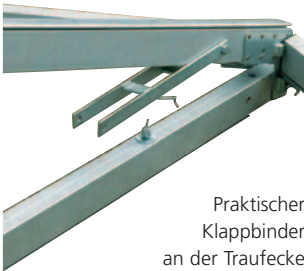
Praktischer Klappbinder an der Traufecke