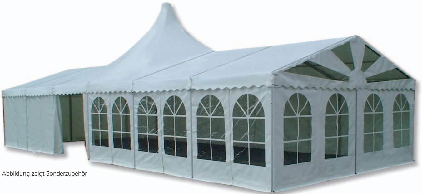
Abbildung zeigt Sonderzubehör