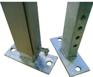
Die Fußplatten sind serienmäßig höhenverstellbar und werden mit Erdnägeln sicher im Boden befestigt