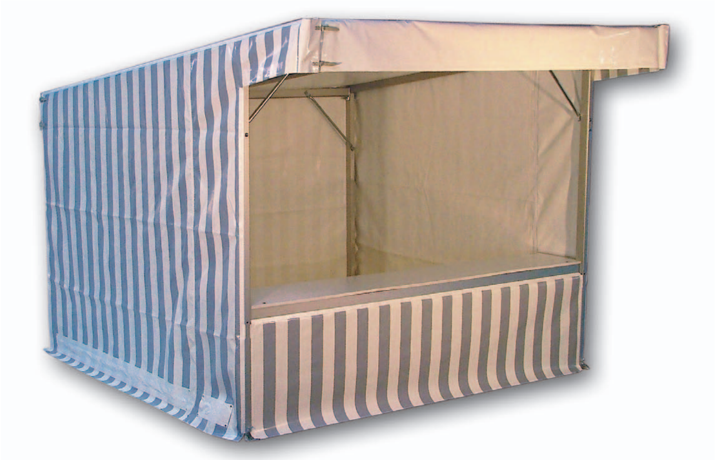
Image ist im 2,0 oder 3,0 m Raster beliebig erweiterbar. Ob Spezialtheke, feste Verkleidung oder Spezialfußboden – wir bauen ihn so, wie Sie ihn brauchen