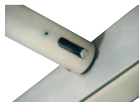
Mittels Federverschluss werden die Tuchhalter für die Dachplane befestigt