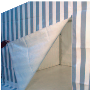
Auf beiden Stirnseiten ein Eingang geteilt mit einem Spiralreißverschluss