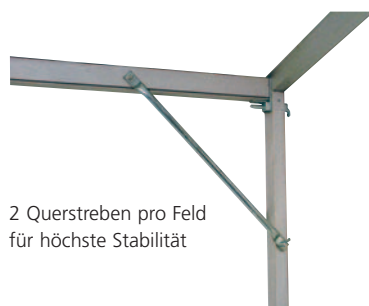
2 Querstreben pro Feld für höchste Stabilität