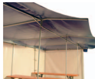
Das 70 cm Vordach sieht schick aus und schützt vor Schlagregen und tiefstehender Sonne

Leichte, diebstahlsichere Befestigung mittels Innensechskantschlüssel direkt am Festzelttisch – ein breiter Tellerrand beugt Beschädigungen der Tischplatte vor