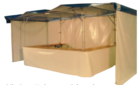
Mit einem Umbausatz wird aus der Biertischüberdachung ein Verkaufsstand mit 7,6 m Verkaufstheke und dreiseitiger Überdachung für Ihre Kunden