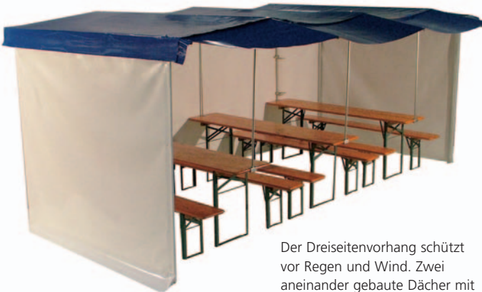
Der Dreiseitenvorhang schützt vor Regen und Wind. Zwei aneinander gebaute Dächer mit Dachrinne und zwei Vorhängen ergeben ein kleines Partyzelt