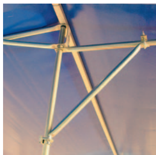
Auch bei stärkerem Wind sicherer Stand mit den Sturmwindeln

Nur 3 verschiedene Gestängeteile sorgen für ein Baukastensystem und schnellste Montage