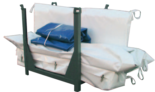
Sicher und kompakt verpackt in der Lager- und Transportbox ...