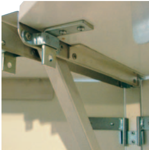
Die Thekenplatten werden mit Stahlhaken in die Thekenhalterungen eingehängt