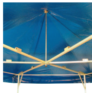
Das innovative Spannsystem der Dachplane