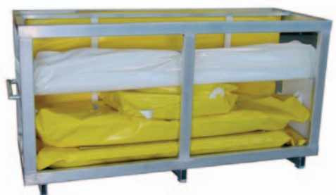
... oder dem Aluminium-Transportgestell mit Facheinteilung