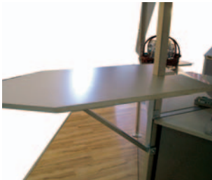
Anbautisch für Pfosten 70 x 40 cm (nachrüstbar ohne Anbringung von Bohrungen für jeden Sixtett ab Baujahr 1995)