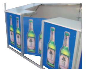
Die Eingangsklappe für den Rundumverkauf