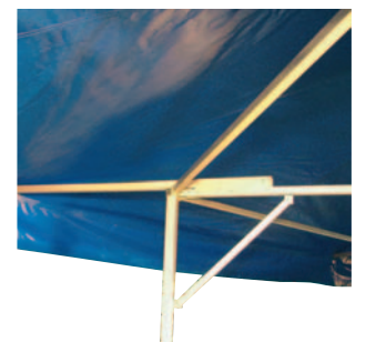
Durch Herausschieben des Vordachspanners entsteht ein Vordach mit 70 cm rundum – die Sicherung erfolgt mittels Schnellverschlusstechnik.