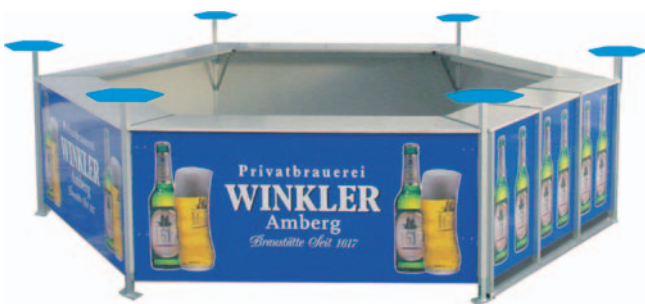
Sixtett mit geteilten Fußstützen, ohne Dach und sechs Ablagetischen.